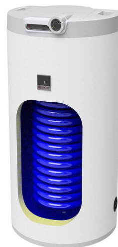
ОКС 160 NTR/HV