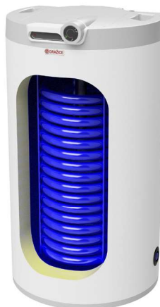
ОКС 100.1, 125.1 NTR/HV