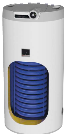
ОКС 100, 125 NTR/HV